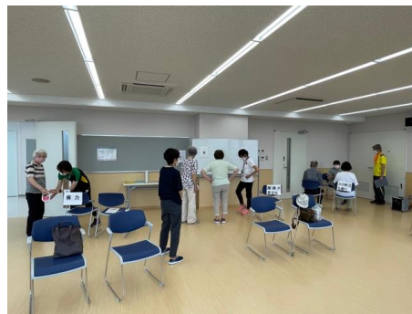
体力測定（握力他3種）