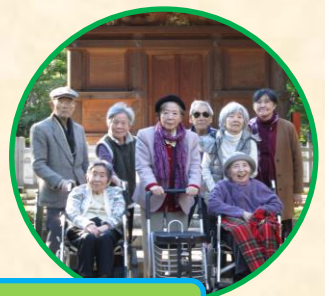
豪徳寺で・ハイポーズ