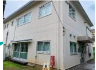
三宿地区会館 外観